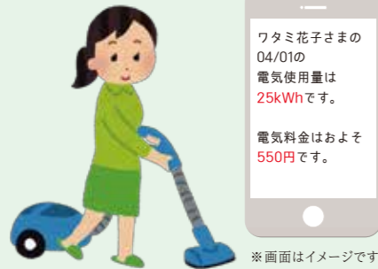
※画面はイメージです