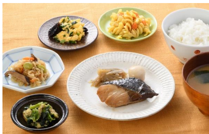
右写真は、「ワタミの宅食ダイレクト」商品 盛り付けイメージ (写真は「おまかせコース」の「ブリの照り焼き」) ※ご飯、お味噌汁、食器は商品に含まれておりません。