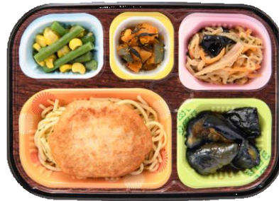
献立例：豆腐ハンバーグ